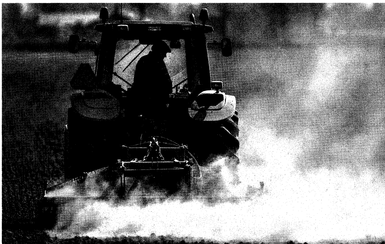
'De boer heeft het directe contact met de markt verloren.'